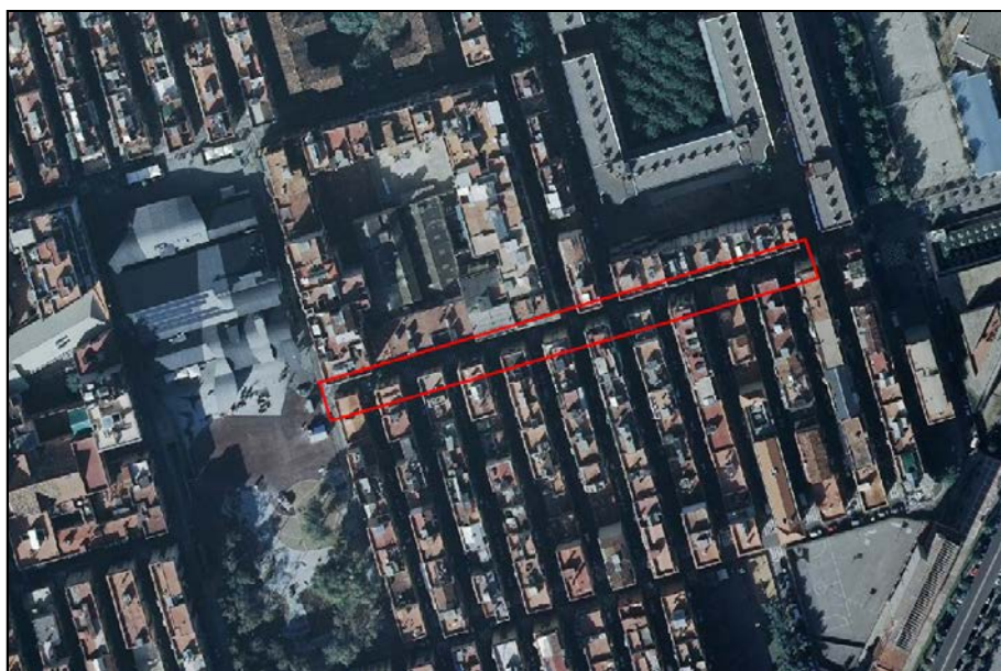
Vista aèria del carrer afectat per la intervenció

Situat en l'extrem sud-est de Barcelona, el barri marítim de la Barceloneta és una llengua de terra de forma gairebé triangular que dibuixa una petita península, d'unes 71 hectàrees, formada per sediments marins degut a l'acumulació de la sorra arrossegada per les corrents marines del nord i dels sediments procedents del riu Besòs, detinguts uns i altres per l'espigó del port durant els molts anys que va durar la seva construcció iniciada al segle XV.